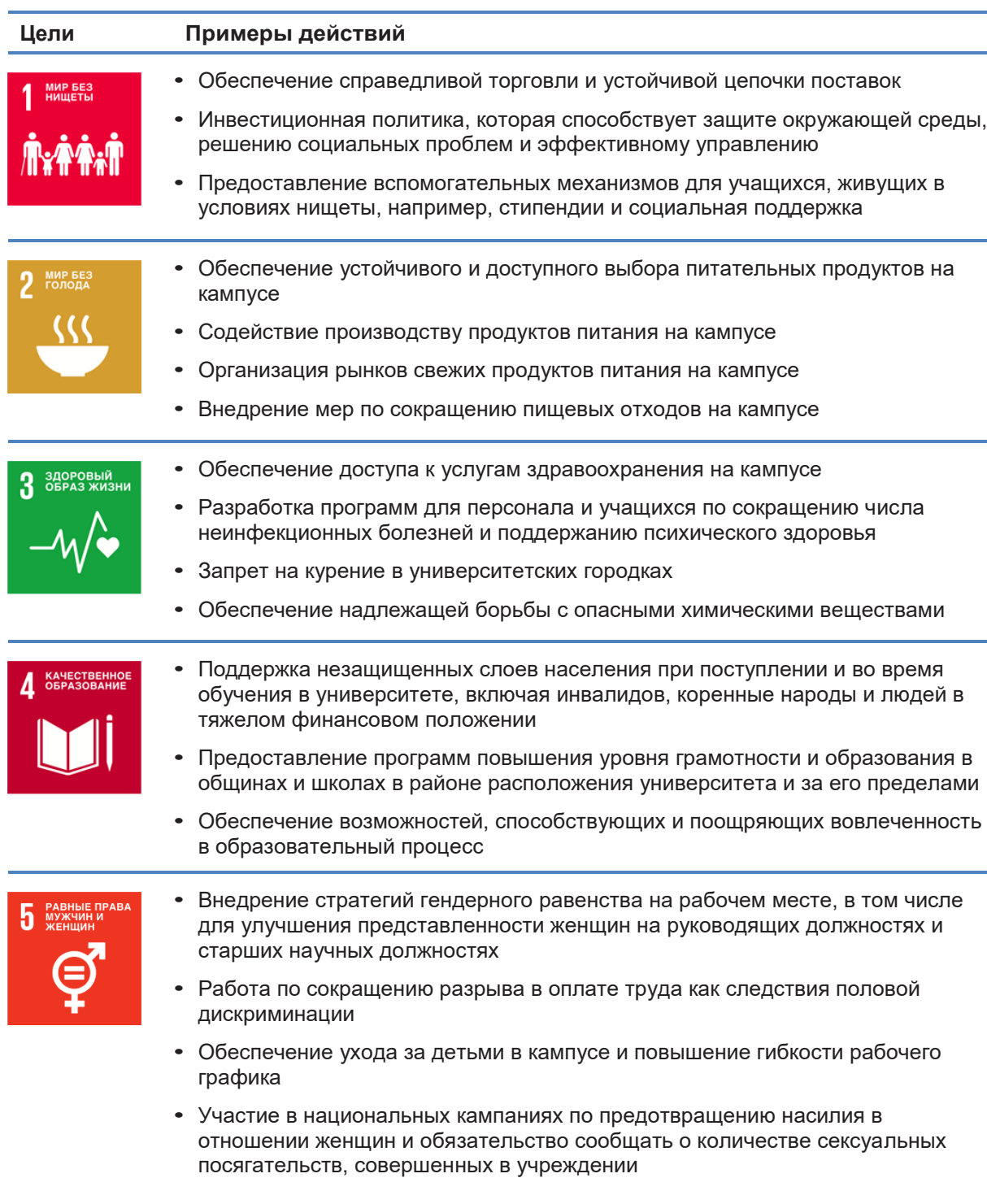
Таблица 3. Примеры действий, которые университеты могут предпринять для реализации ЦУР через свои внутренние операции