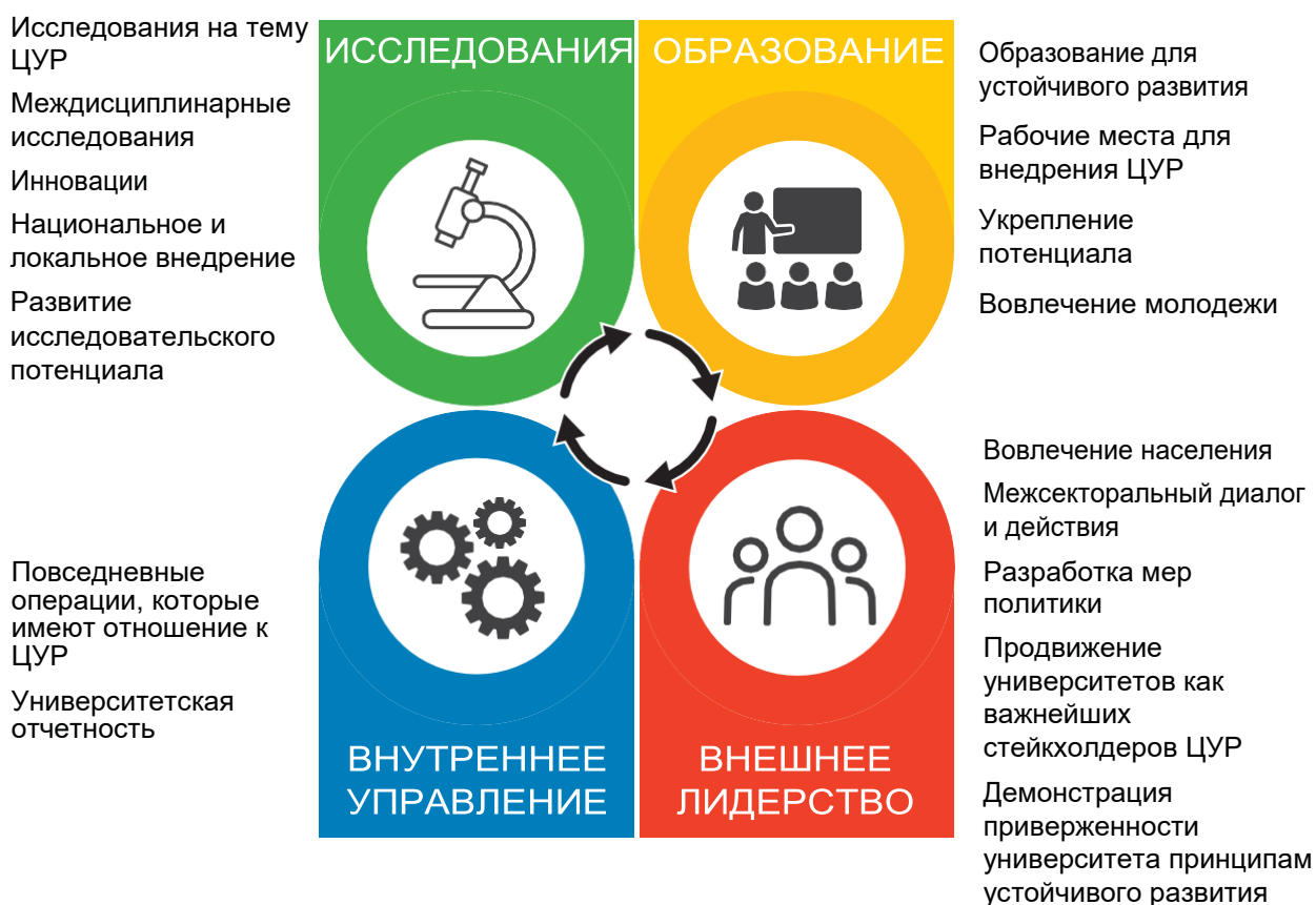
Рисунок 2. Обзор вклада университетов в развитие ЦУР

Рисунок 2 обобщает структуру данного раздела и представляет краткий обзор мер, которые университеты могут предпринять для реализации ЦУР.