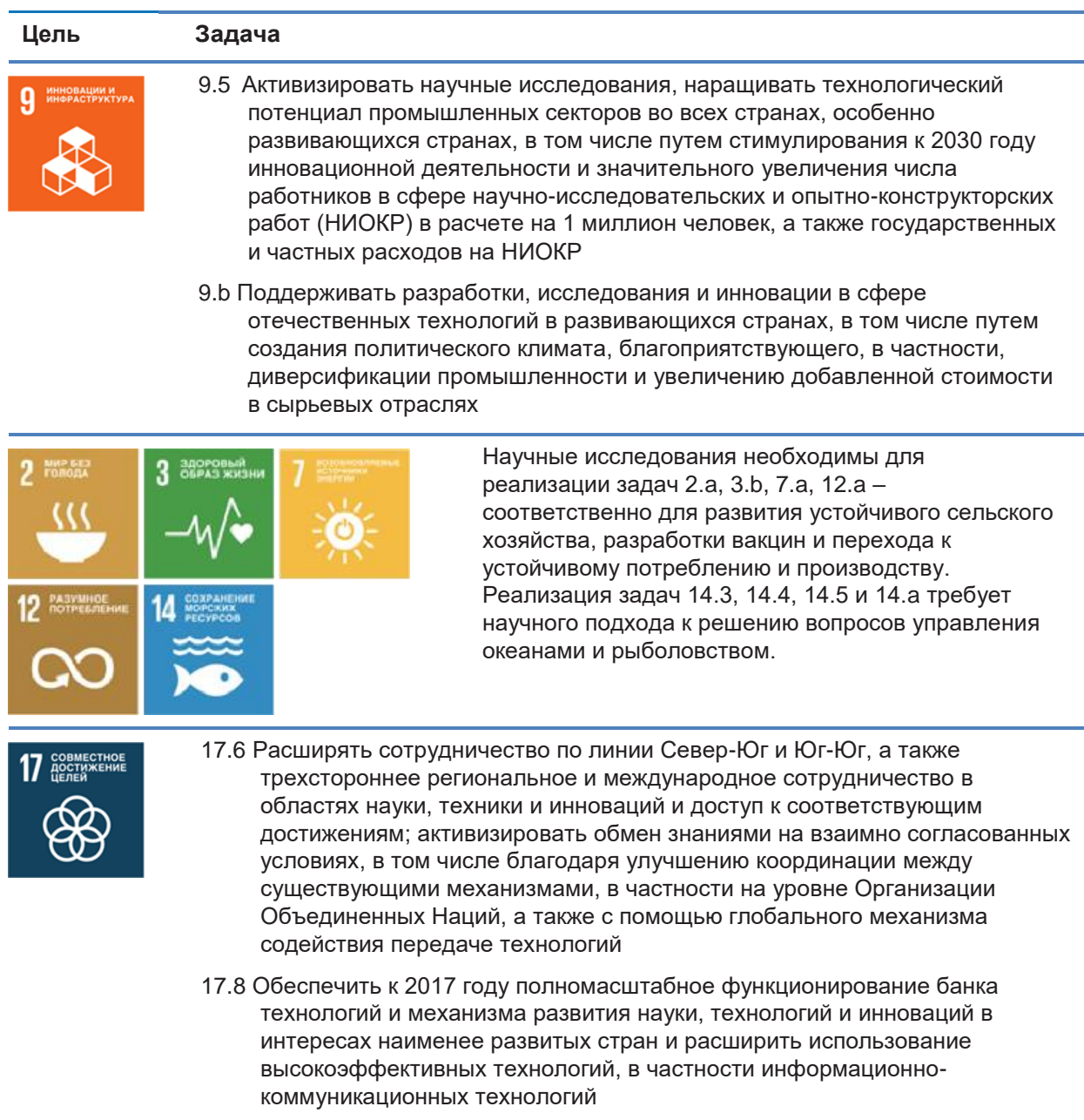
Таблица 2: Задачи «Повестки-2030», непосредственно связанные с исследованиями.

Ряд задач «Повестки-2030» требует проведения научных исследований. Многие из этих задач считаются «средствами внедрения ЦУР». Задачи, связанные с университетскими исследованиями, представлены в таблице 2.