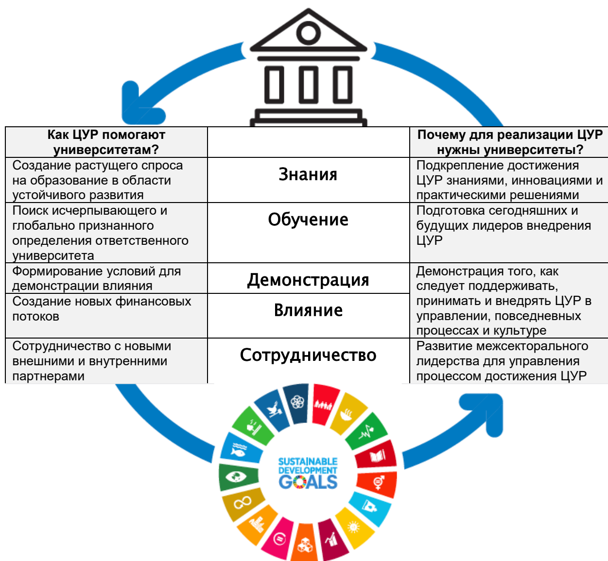
Рисунок 1: Вовлечение университета в работу по внедрению ЦУР

Университеты занимают уникальную позицию в обществе. Выполняя широкий круг функций в области создания и распространения знания, университеты в течение длительного времени являлись мощными движущими силами глобальных, национальных и локальных инноваций, экономического развития и общественного благополучия [6, 7, 8]. Поэтому университеты играют решающую роль в достижении ЦУР. Кроме того, сами университеты могут извлечь значительную пользу от работы с Целями устойчивого развития (Рисунок 1).